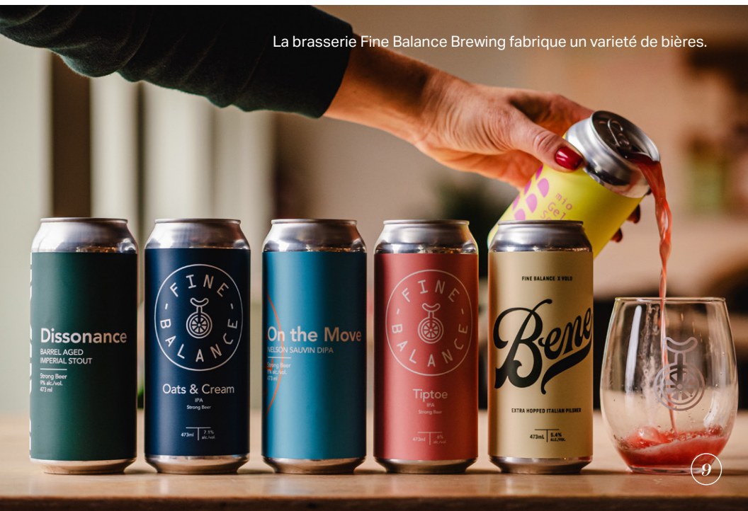
La brasserie Fine Balance Brewing fabrique un variété de bières.

Découvrez les boissons fabriquées localement : visitekingston.ca/choses-a-faire