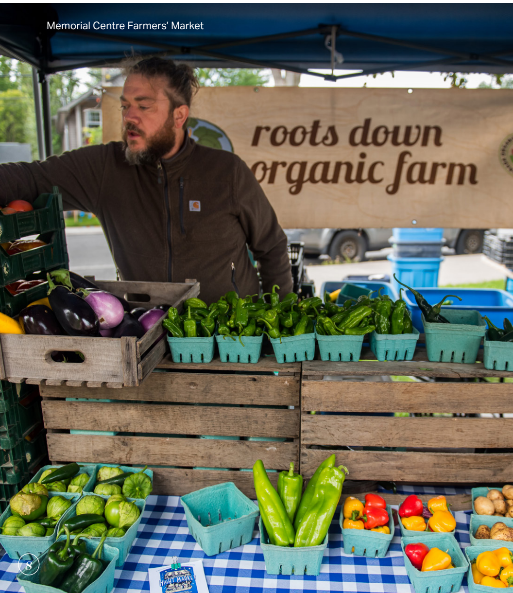
Memorial Centre Farmers' Market

Kingston est également située au cœur des terres agricoles du comté de Frontenac. Les fermes de Frontenac fournissent les tables de Kingston et les chefs de Kingston utilisent des ingrédients frais et de saison provenant de producteurs locaux.