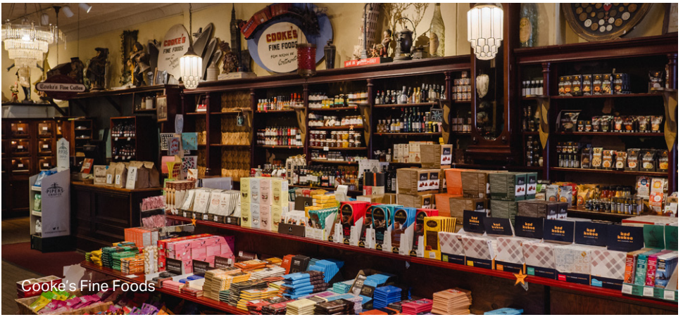
Cooke's Fine Foods