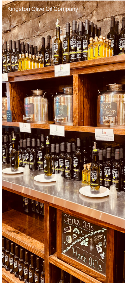
Kingston Olive Oil Company