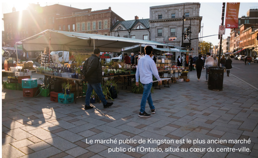
Le marché public de Kingston est le plus ancien marché public de l'Ontario, situé au cœur du centre-ville.

Découvrez ces attractions et beaucoup plus : visitekingston.ca